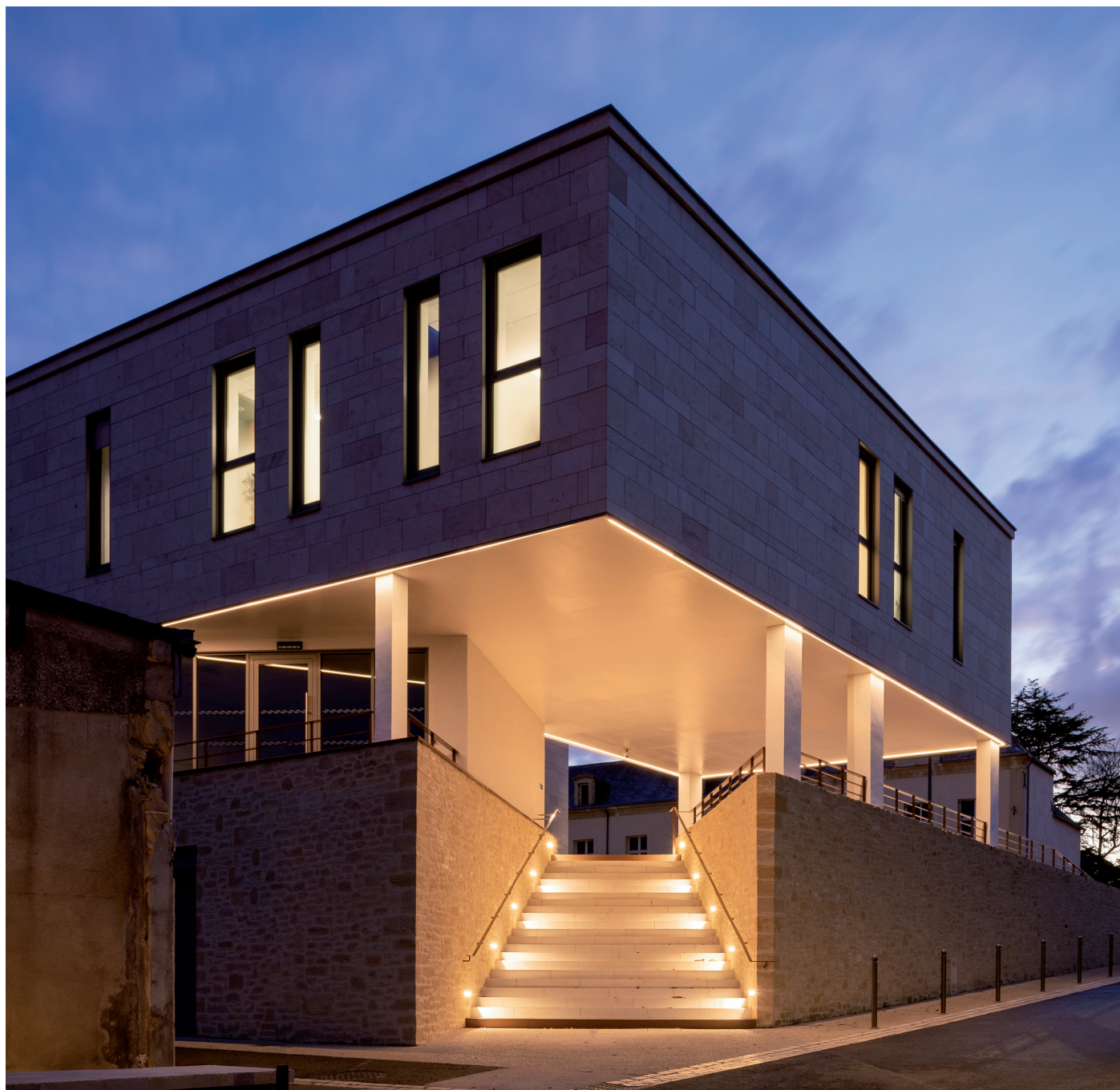
MSP - Doué-en-Anjou (49)

SANTÉ ET ARCHITECTURE, UNE SYNERGIE AU CŒUR DE DOUÉ-EN-ANJOU !