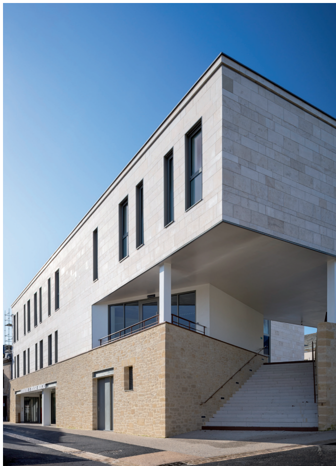
MSP - Doué-en-Anjou (49)