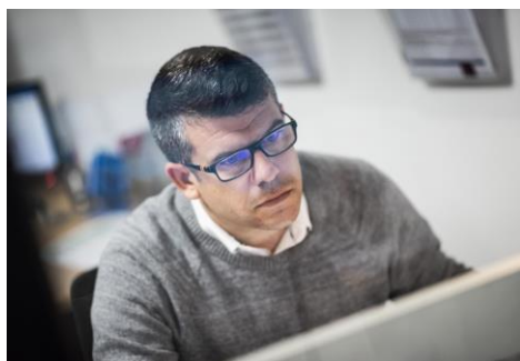
Bureau d'études intégré LOUINEAU

Attentif aux évolutions du marché et aux remontées du terrain, le spécialiste des systèmes de fixation LOUINEAU s'attache à concevoir et fabriquer des solutions qui répondent à toutes les nouvelles configurations . Son leitmotiv : faciliter toujours plus la mise en œuvre des entreprises de pose, artisans et façadiers. Son bureau d'études intégré a ainsi pour mission* d'analyser l'offre des gammistes afin de développer et proposer rapidement des pièces de fixation standard pour chaque série et chaque référence de profil . Le renouvellement de la gamme de fenêtres et portes-fenêtres SOFTLINE 70 de VEKA illustre cette démarche d'adaptation poussée . Le bureau d'études LOUINEAU, en collaboration avec le gammiste VEKA et le fabricant-installateur de menuiseries BATISTYL Habitat, a créé un unique clameau ajustable à la fois sur l'ancien et le nouveau profil grâce à sa forme Omega et à ses deux cotes fonctionnelles . Cette solution 1/4 de tour intègre également une plage de réglage de la patte plus importante et des griffes qui assurent un accrochage maximal au profil. Elle constitue une source d'économie et un gain de temps, de la prise de commande à l'installation sur chantier pour les installateurs .